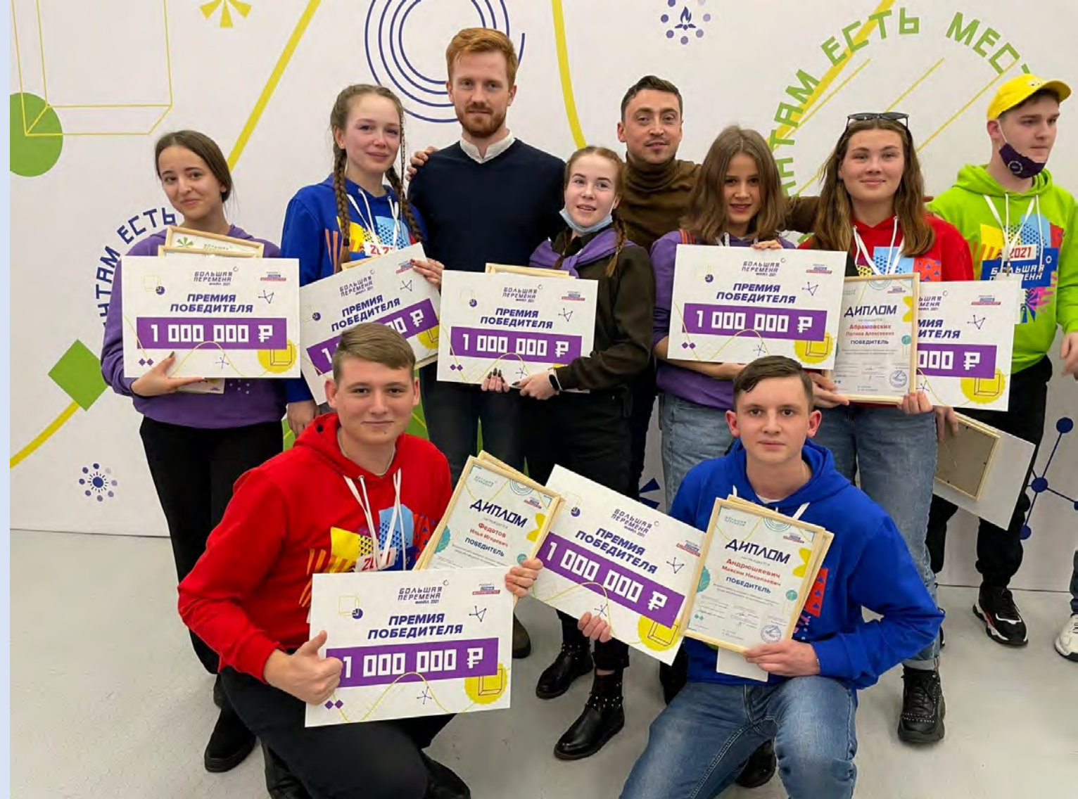
Всероссийский конкурс «Большая перемена»