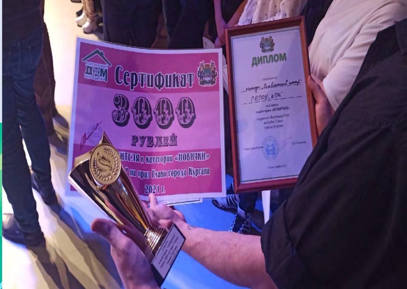
Фестиваль команд КВН